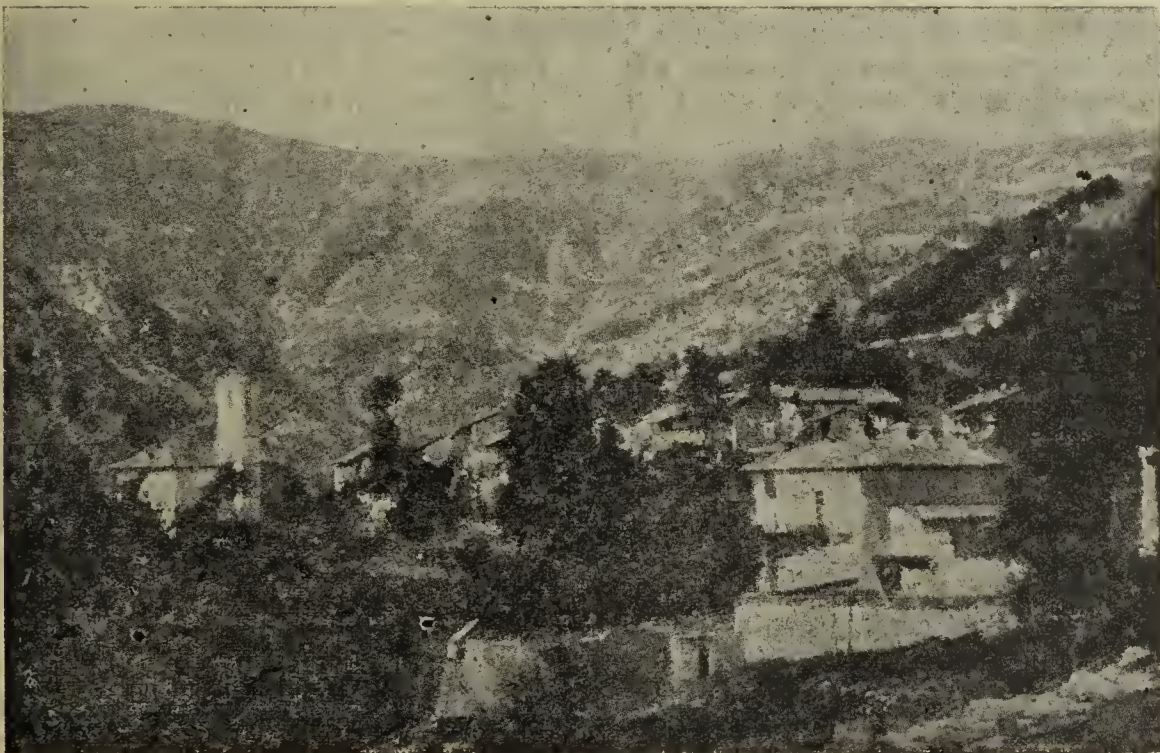
"Templo y Prebiterio de Pramollo"

Pramollo es parroquia de alta montaña —muchas de sus aldeas están ubicadas más